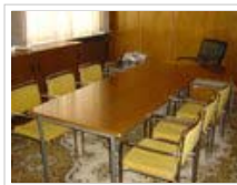
Büro des Leiters des Sekretariats