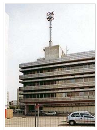
Gebäude der Hauptabteilung III (HA III) – Funkaufklärung, Funkabwehr, in Berlin-Lichtenberg, Gotlindestraße