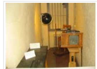
„Fotostuhl“ des MfS für Aufnahmen der erkennungsdienstlichen Fotos. Vorne links ist der Tisch zur Abnahme von Fingerabdrücken.

Am 24. Januar 1950 fasste das Politbüro der SED den Beschluss zur Bildung des MfS. Zwei Tage später empfahl die Regierung der DDR parallel zum eigenen „ Beschluss über die Abwehr von Sabotage “ ebenfalls die Bildung des MfS. Am 8. Februar 1950 bestätigte die Volkskammer der DDR einstimmig die Bildung des MfS. Als Leiter wurde acht Tage später Wilhelm Zaisser eingesetzt. Erich Mielke war sein Stellvertreter im Range eines Staatssekretärs. Im Jahr 1950 beschäftigte das MfS etwa 2700 hauptamtliche Mitarbeiter, im Jahr 1953 schon rund 13.000. [1]