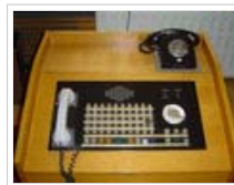
Büro von Erich Mielke