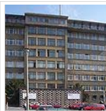
Haus 1, Sitz des Ministers, jetzt Forschungs- und Gedenkstätte Normannenstraße, 2005

Die Zentrale des Ministeriums in Berlin-Lichtenberg nahm einen ganzen Häuserblock zwischen Frankfurter Allee, Magdalenenstraße, Normannenstraße und Ruschestraße ein. Dazu kam der Komplex in der Gotlindestraße. Das Hauptgebäude, in dem auch der Minister für Staatssicherheit Erich Mielke und sein Sekretariat ihre Büros hatten, ist seit 1990 zu einem Museum, der Forschungs- und Gedenkstätte Normannenstraße, ausgebaut worden und steht unter Denkmalschutz. [9] Zugänglich sind unter anderem die original erhaltenen Büroräume Mielkes sowie mehrere Ausstellungen zur DDR-Geschichte mit Bezug auf das MfS.