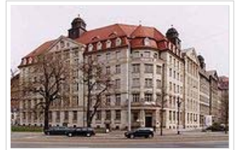
MfS-Bezirksverwaltung Leipzig „Runde Ecke“ Dittrichring