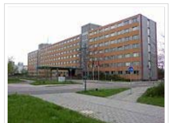
MfS-Bezirksverwaltung Halle, am Rande von Halle-Neustadt