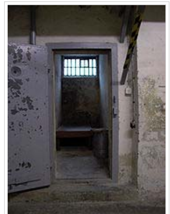
Untersuchungsgefängnis des MfS in Berlin Hohenschönhausen, heute Gedenkstätte Hohenschönhausen. Die Hauptabteilung IX, das Disziplinar- und Untersuchungsorgan des MfS, war hier zuständig