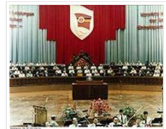
„Kampftreffen“ im Palast der Republik in Ost-Berlin anlässlich des 35. Jahrestages der Bildung des Ministeriums für Staatssicherheit, 1985

Die Führungsrolle der SED war in Artikel 1 der DDR-Verfassung von 1968 verankert: