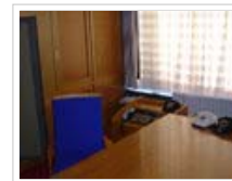
Büro von Erich Mielke