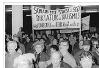
Stürmung der Stasi-Zentrale im Januar 1990.

Später billigte der Runde Tisch die Selbstauflösung der Auslandsaufklärung des MfS (Hauptverwaltung Aufklärung, kurz HV A), deren Leiter von 1956 bis 1986 Markus Wolf, ein Stellvertreter Erich Mielkes, war. Trotz der folgenden Vernichtung fast aller Akten und Datenträger der HV A gelangten 1990 deren Mob - (Mobilmachungs-) Karteien unter ungeklärten Umständen in die Hände der CIA. Sie wurden später unter dem Namen „Rosenholz-Akten“ bekannt und der Bundesregierung kopiert überlassen.