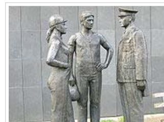
Denkmal mit Arbeitern und Volkspolizist in Uniform vor dem Informations- und Dokumentationszentrum der BStU in Berlin (Mitte)