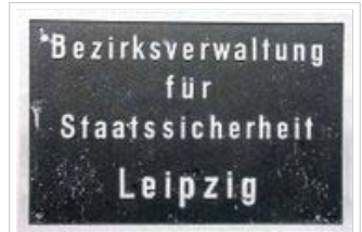
Amtsschild der MfS-Bezirksverwaltung Leipzig