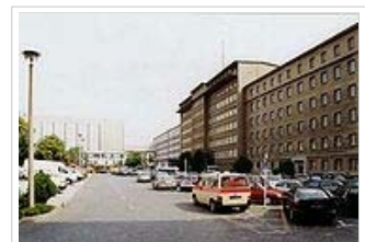
Rechts Blick auf Haus 1, Büro der Leitung des Ministeriums, dahinter rechts in weiß, Haus 2, der Sitz der Hauptabteilung II (HA II) – Spionageabwehr

Zum Zeitpunkt des Zusammenbruches der DDR gab es in der Bundesrepublik Deutschland rund 2000 aktive MfS-Spione, wie die veröffentlichte Auswertung der sogenannten Rosenholz-Dateien im März 2004 ergab. [8] Die Anzahl der IM, welche für die Hauptverwaltung Aufklärung in der DDR selbst tätig waren, wurde dabei mit 20.000 beziffert. Das MfS unterstützte in der Bundesrepublik Deutschland ihm nützlich erscheinende politische Kräfte. So wurden unter dem Decknamen „Gruppe Ralf Forster“ in der DDR ausgewählte Kader der DKP im Nahkampf und Sprengstoffeinsatz ausgebildet. Die Unterlagen des MfS zur „Gruppe Ralf Forster“ wurden geschreddert und im Jahr 2004 wieder in der Birtler-Behörde rekonstruiert.