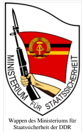
Wappen des Ministeriums für Staatssicherheit der DDR

Neben dem MfS gab es auch einen weiteren Nachrichtendienst in der DDR, die Verwaltung Aufklärung der NVA (militärischer Aufklärungsdienst) mit Sitz in Berlin-Treptow. Die Verwaltung Aufklärung wurde ebenso wie die Grenztruppen und die restliche NVA durch die Hauptabteilung I (MfS-Militärabwehr) kontrolliert („abgesichert“).