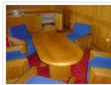
Büro von Erich Mielke